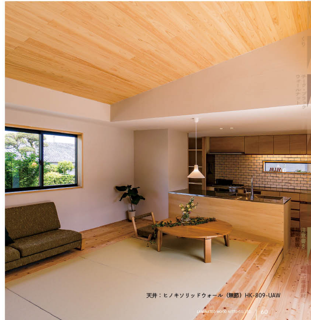
天井：ヒノキシリッドウォール（無節）HK-809-UAW